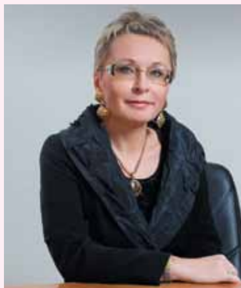
Ирина ГОРБУЛИНА, президент Российской академии бизнеса и предпринимательства

Нас, женщин, в России больше. На 10 миллионов! Мы умны, инициативны, образованны.