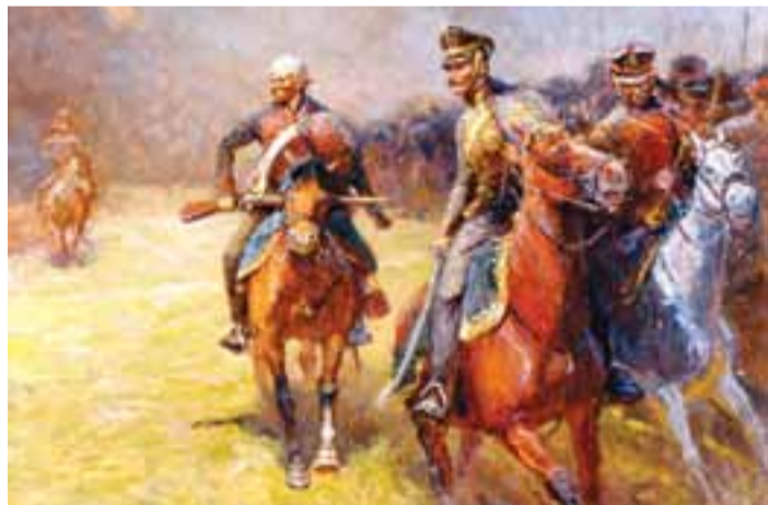
Перед схваткой. Художник А.С. Чагадаев

историю России и привить потомкам уважение к своему прошлому.