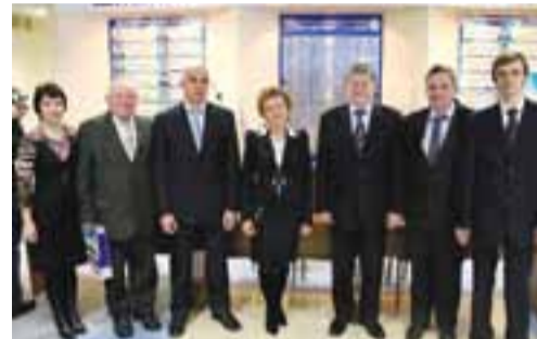
Лауреаты конкурса «Инженер года-2011» – работники ОАО «Щекиноазот»