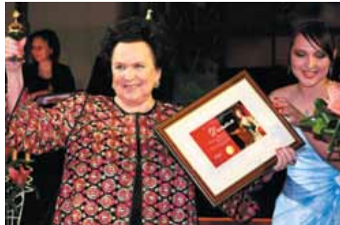
Народная артистка СССР Галина ВИШНЕВСКАЯ, лауреат IX Национальной премии общественного признания достижений женщин России «Олимпия»

6 марта в гостинице «Метрополь» Российская академия бизнеса и предпринимательства проводит X юбилейную торжественную церемонию вручения Национальной премии общественного признания достижений женщин России «ОЛИМПИА».