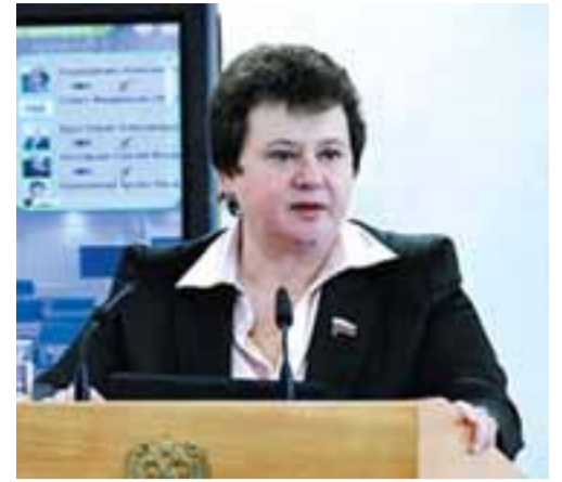
Светлана ОРЛОВА, вице-спикер Совета Федерации ФС РФ

носить результативность политики природосбережения и устойчивого развития всех субъектов Российской Федерации. Совет Федерации как палата регионов заинтересован в этом», – подчеркнула глава верхней палаты парламента. Она также напомнила, что в этом году конгресс пройдет накануне Конференции ООН по устойчивому развитию «RIO + 20». По мнению спикера, встреча призвана не только сверить экологические прогнозы двадцатилетней дав-