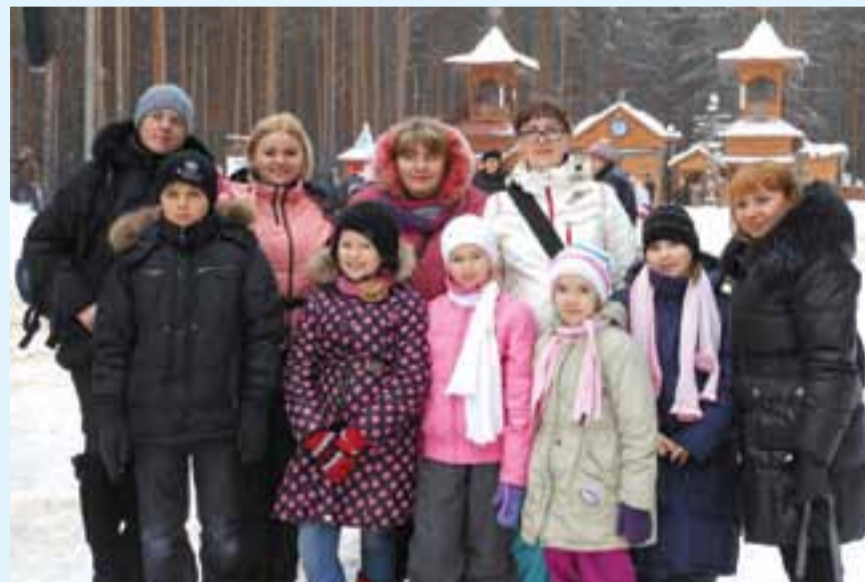
Железнодорожное путешествие в январе этого года на родину Деда Мороза в Великий Устюг принесло сотрудницам ГУП «Москоллектор» и их детям много радости и ярких, незабываемых впечатлений

В ГУП «Москоллектор» разработан комплексный пакет социальной поддержки работающих мам. Так, на предприятии выплачивается ежемесячная материальная помощь работницам, находящимся в отпуске по уходу за ребенком от 1,5 до 3 лет; единовременная материальная помощь при рождении ребенка; единовременная материальная помощь на День Матери, женщинам, имеющим детей в возрасте до 18 лет; дополнительный оплачиваемый выходной день 1 сентября женщинам, имеющим детей-школьников в возрасте до 12 лет; единовременная материальная по-